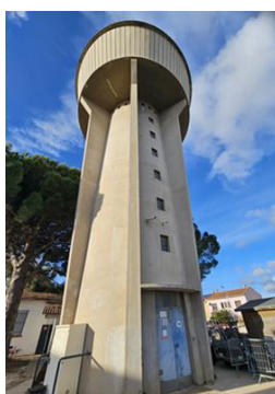
Réservoir sur tour 500 m 3