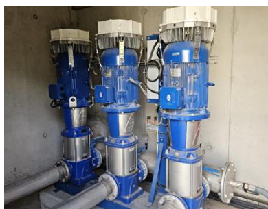
Station surpression la chapelle